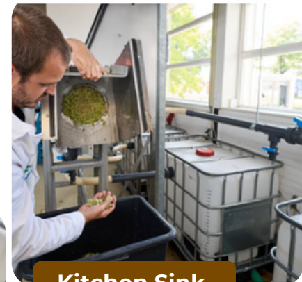
Kitchen Sink Grinder